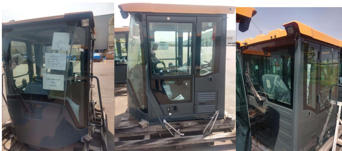
HLB757-9PR, HLB757-9SS e HLB760-9PR